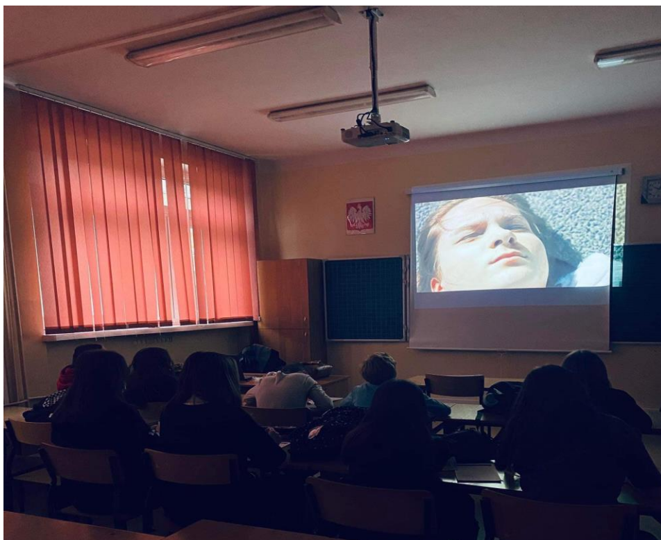
O przemocy w szkołach