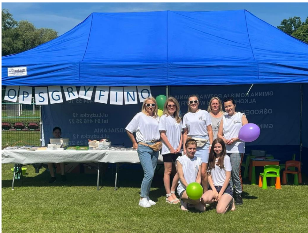
OPS dla Adelki