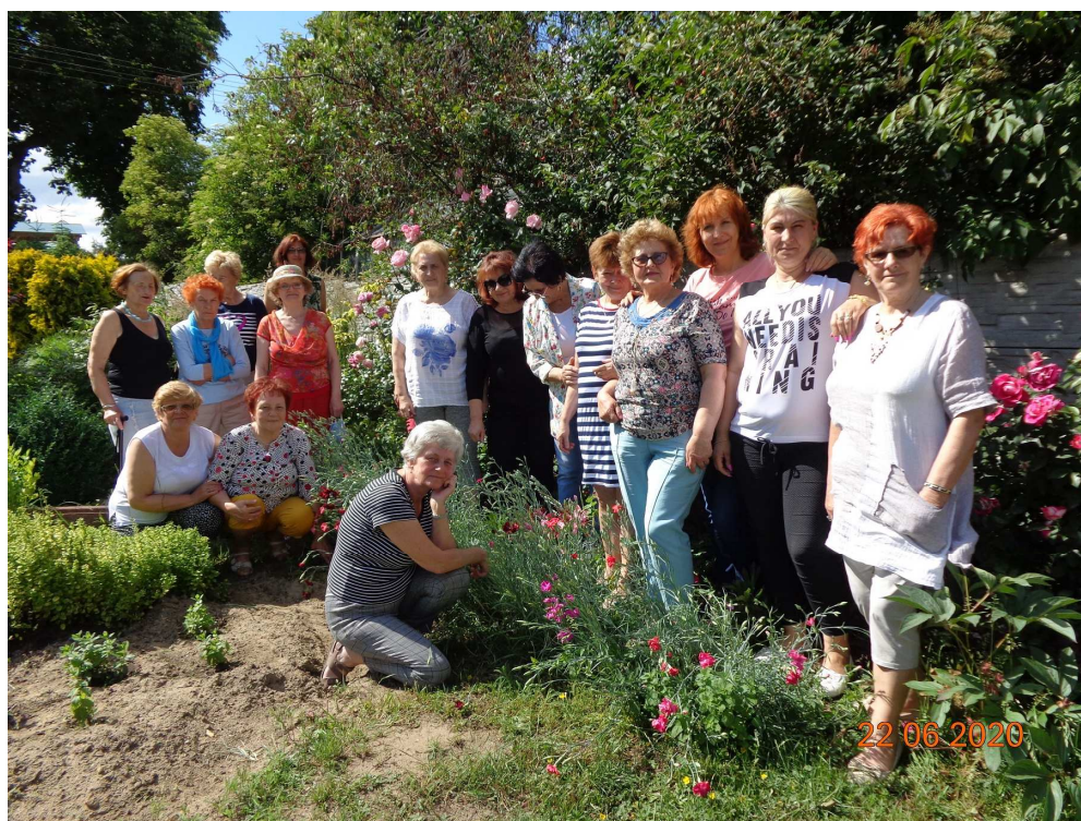
Stowarzyszenie Amazoнок „Ewa” w Gryfinie – „Profilaktyka po chorobie nowotworowej”