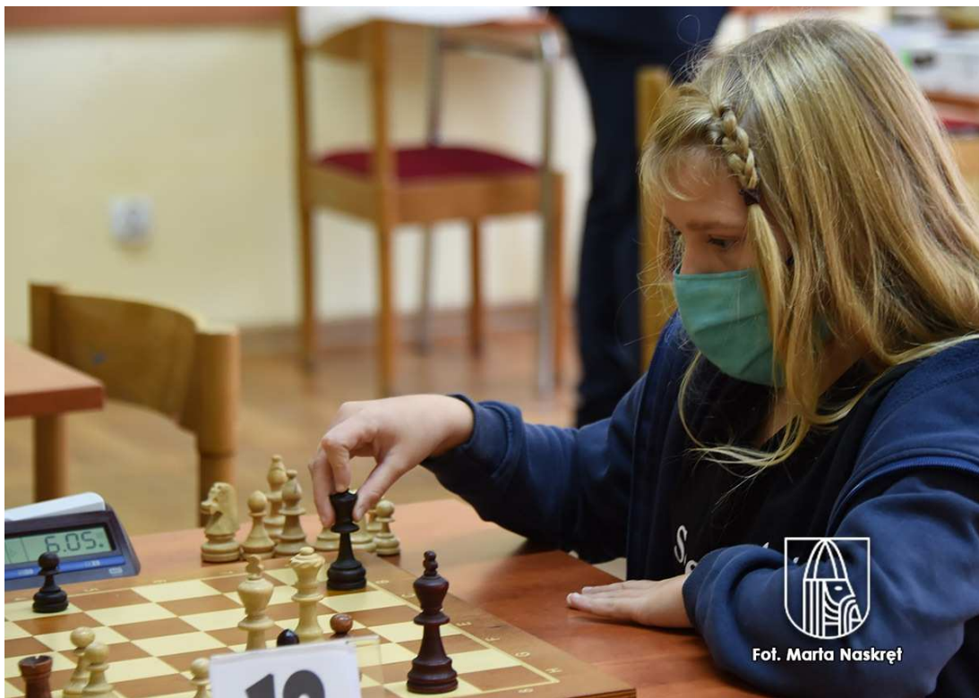
Uczniowski Klub Sportowy „Biały Pion” w Gryfinie – „Organizacja współzawodnictwa sportowego dzieci i młodzieży w zakresie sportu szachowego”