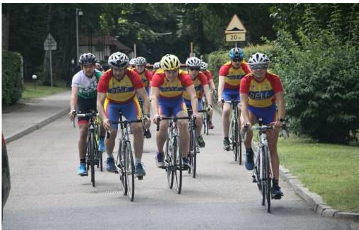
Gryfiński Klub Sportowy „Delf” w Gryfinie – „Organizacja triathlonowego obozu sportowego”