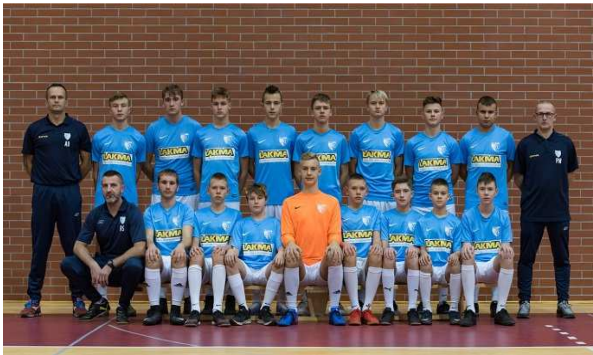
Gminny Klub Sportowy „Błękit” Pniewo – „Organizacja współzawodnictwa sportowego w zakresie piłki nożnej dzieci i młodzieży na rzecz miejscowości Pniewo”