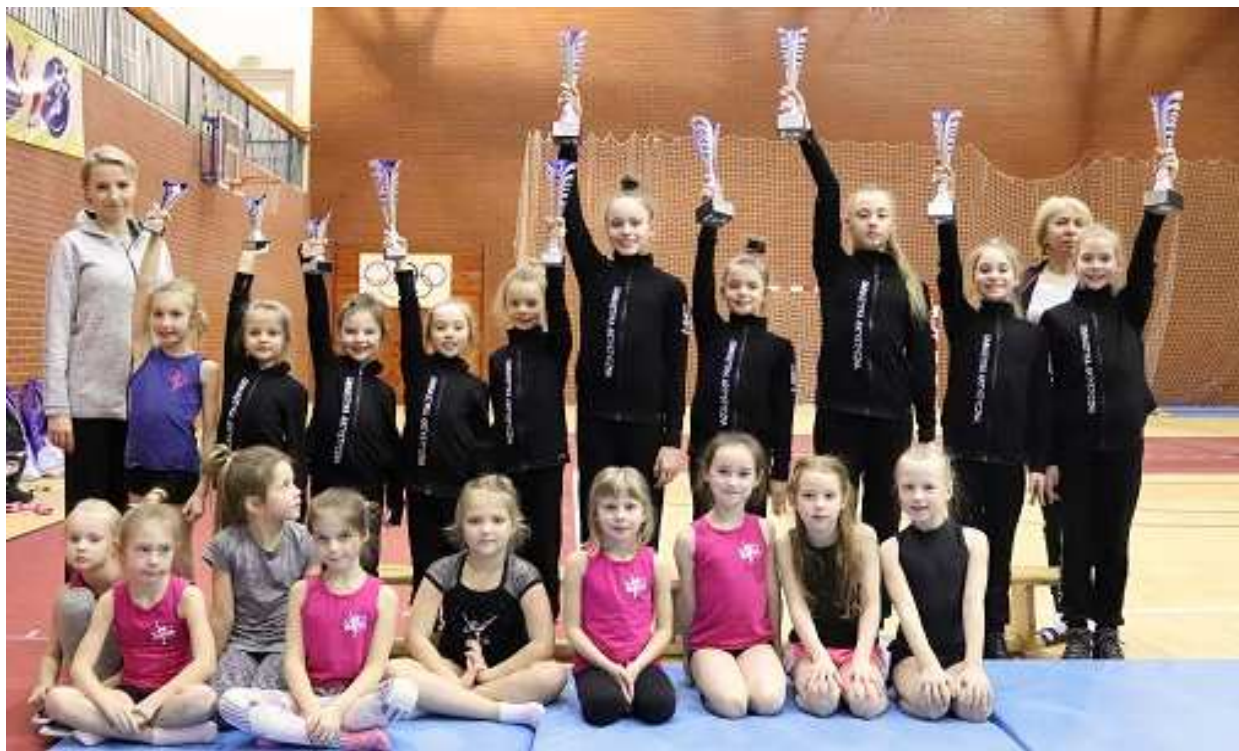
Międzyszkolny Klub Sportowy „Hermes” – „Organizacja współzawodnictwa sportowego dzieci i młodzieży w zakresie gimnastyki artystycznej”