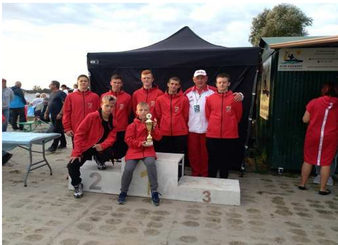
Klub Sportowy „Energetyk” Gryfino – „Ogólnopolskie Mistrzostwa w Kajakarstwie o Puchar Marszałka Województwa Podkarpackiego”