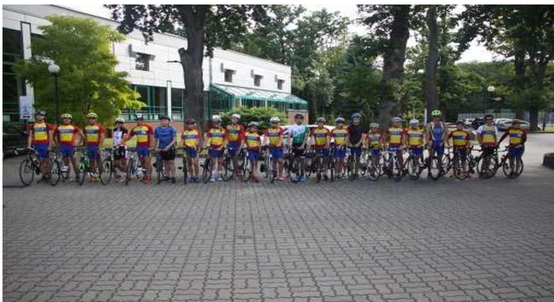
Gryfiński Klub Sportowy „Delf” w Gryfinie – „Organizacja triathlonowego obozu sportowego”