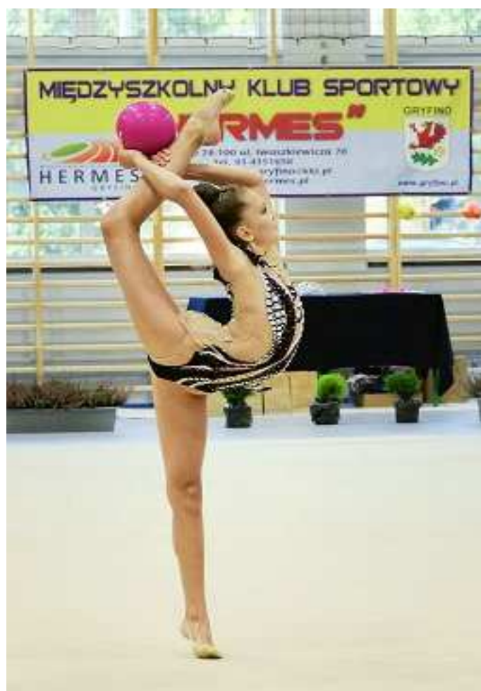
Międzyszkolny Klub Sportowy „Hermes” – „Organizacja współzawodnictwa sportowego dzieci i młodzieży w zakresie gimnastyki artystycznej”