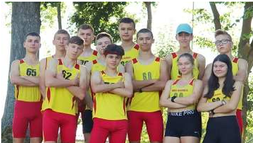
Międzyszkolny Klub Sportowy „Hermes” – „Organizacja współzawodnictwa sportowego dzieci i młodzieży w zakresie lekkoatletyki”